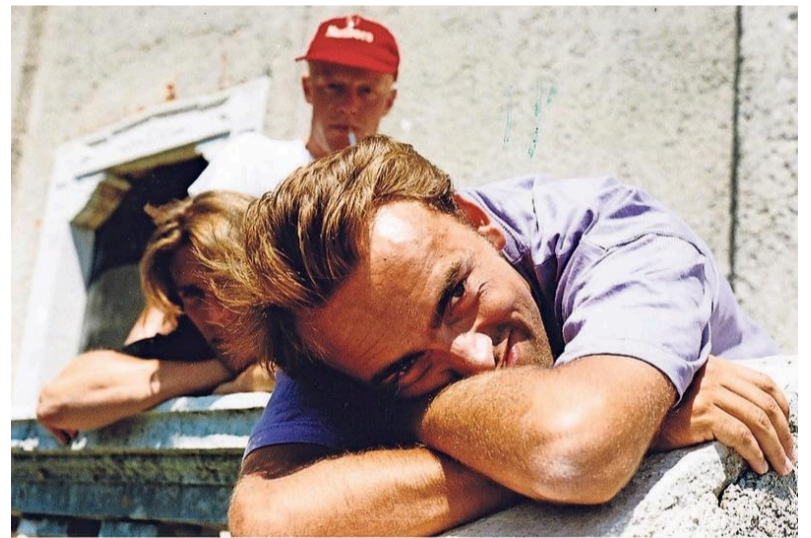
Bob, Carol, Ted & Alice in 1990.