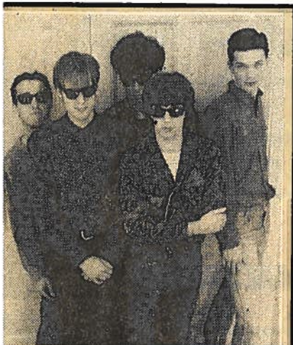
De Five Fantastic Firebirds.

THE FIVE FANTASTIC FIREBIRDS uit Winschoten en Groningen treden voor de tweede keer in korte tijd op in De Toeter te Veendam. Van het eerste optreden zijn opnamen gemaakt, die op cassette in de Winschoter Fonothek ter uitleen wordt aangeboden. Met de live vol vuur gebrachte instrumentale (oude) hits brengen de Firebirds menigeen tot vervoering. Emotionele taferelen (het gelukzalige gevoel) zijn derhalve niet uitgesloten tijdens het optreden in De Toeter, zaterdag 27 december vanaf 23.00 uur.